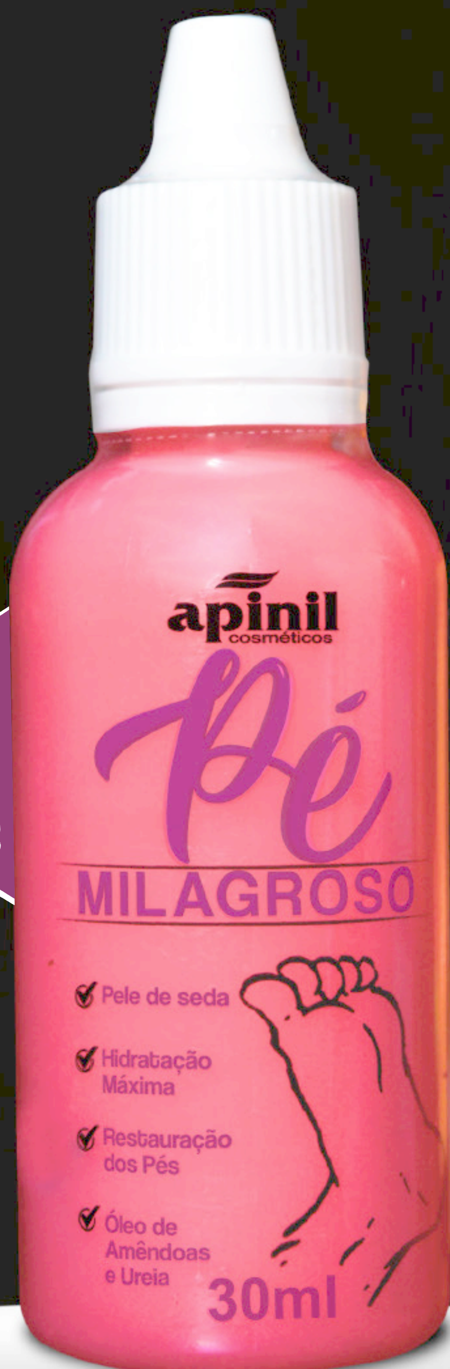
Pé Milagroso - 30ml

Pés bem lisinho sem rachadura, aspereza ou ressecamento.