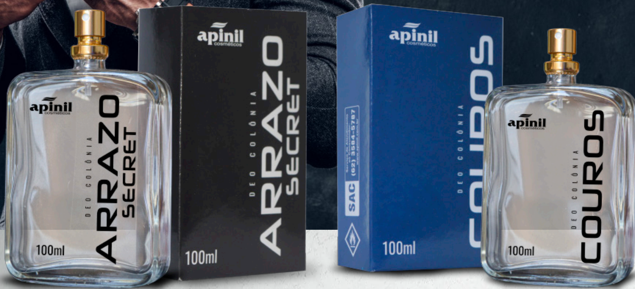
Couros - 100ml Emblemático, Sensual, Quente