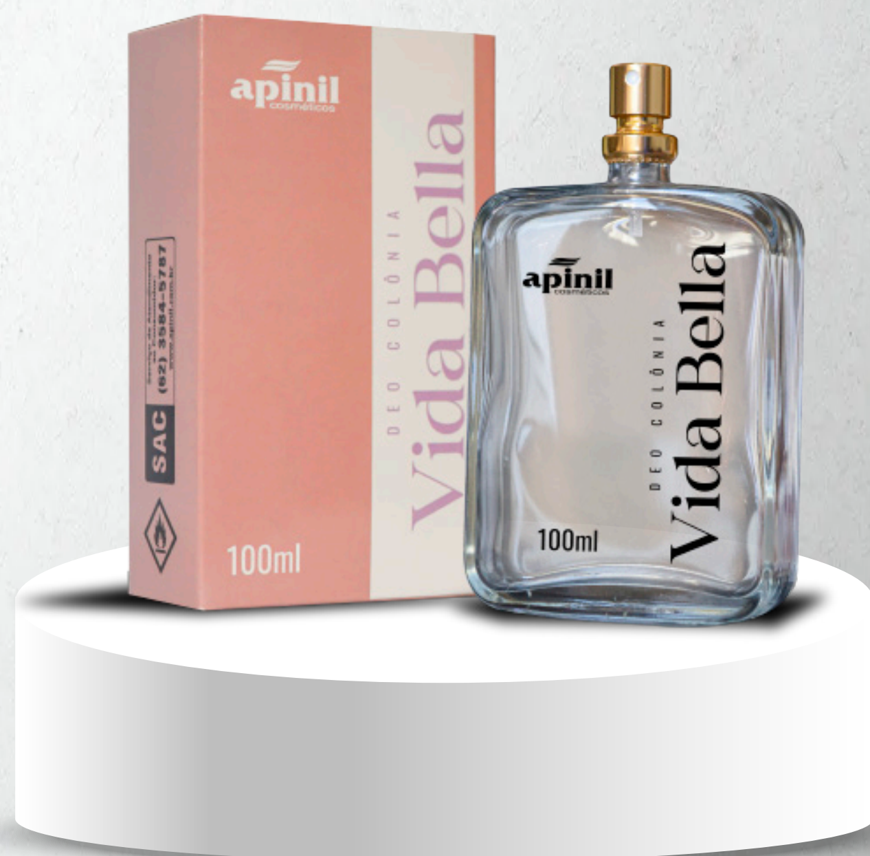
Vida Bella - 100ml Inspirador, Romântico, Encantador