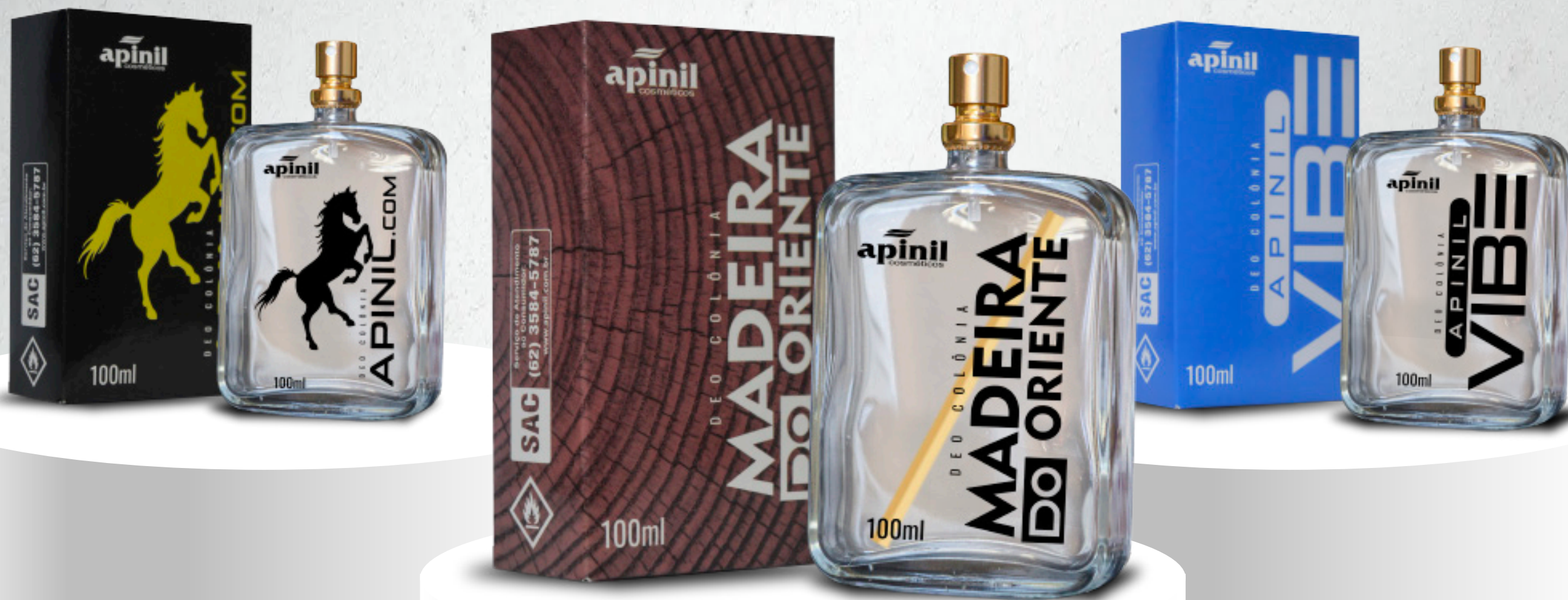
Apinil.Com - 100ml Ousado - Sensual - Misterioso

Colônias para os homens exclusivos de personalidade ímpar e seleta.