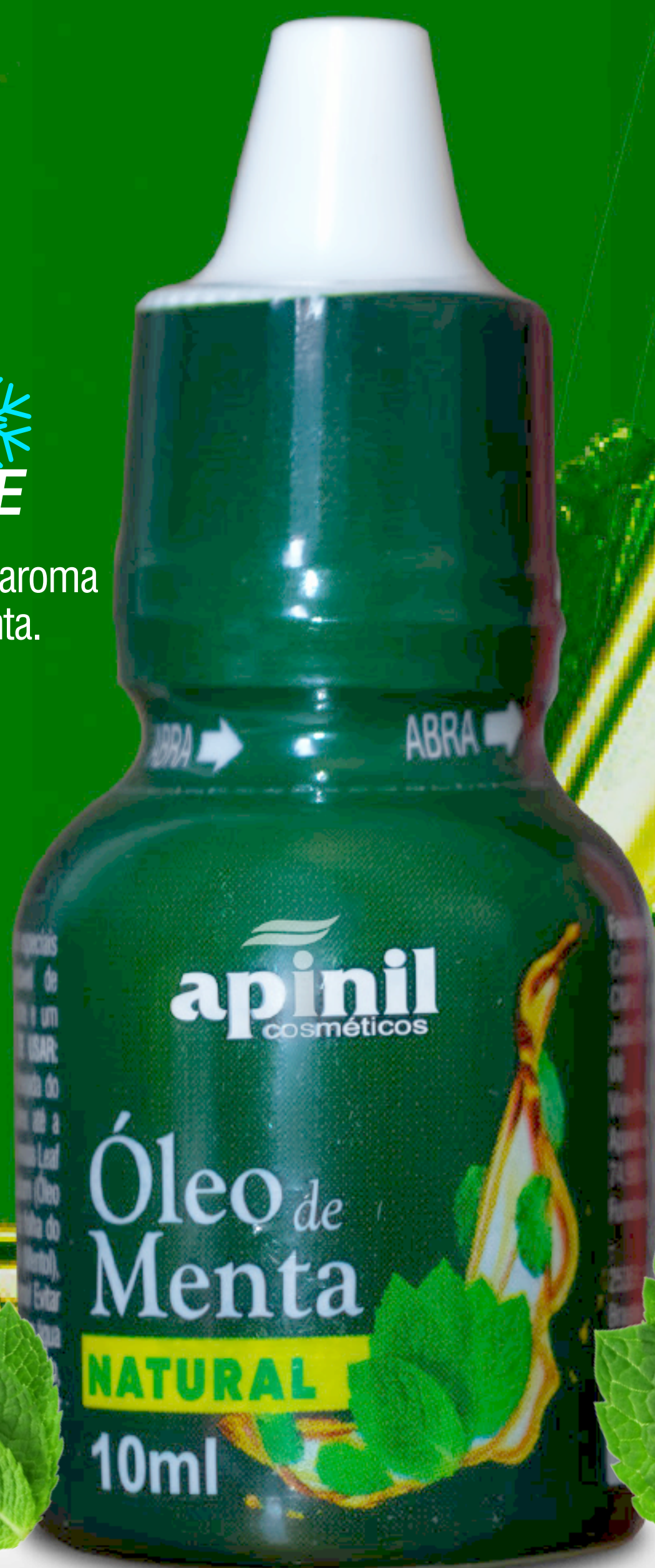
Óleo de Menta NATURAL - 10ml

Tem ação refrescante e um aroma super agradável de menta.