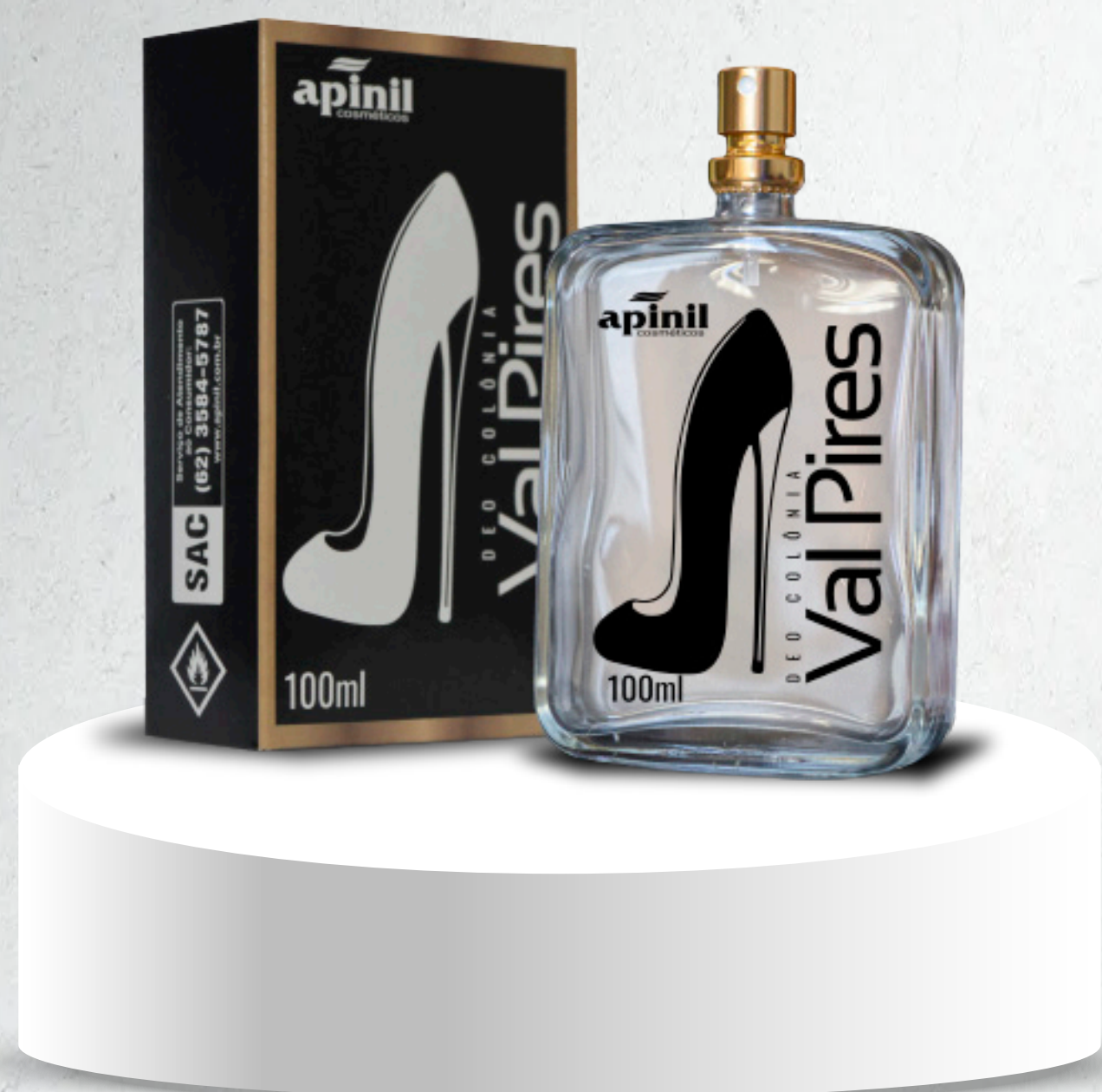
VAL PIRES - 100ml Poderoso - Sensual

Colônias para mulheres únicas , sensual e irreverente de personalidade audaciosa que gosta de se senti irresistível.