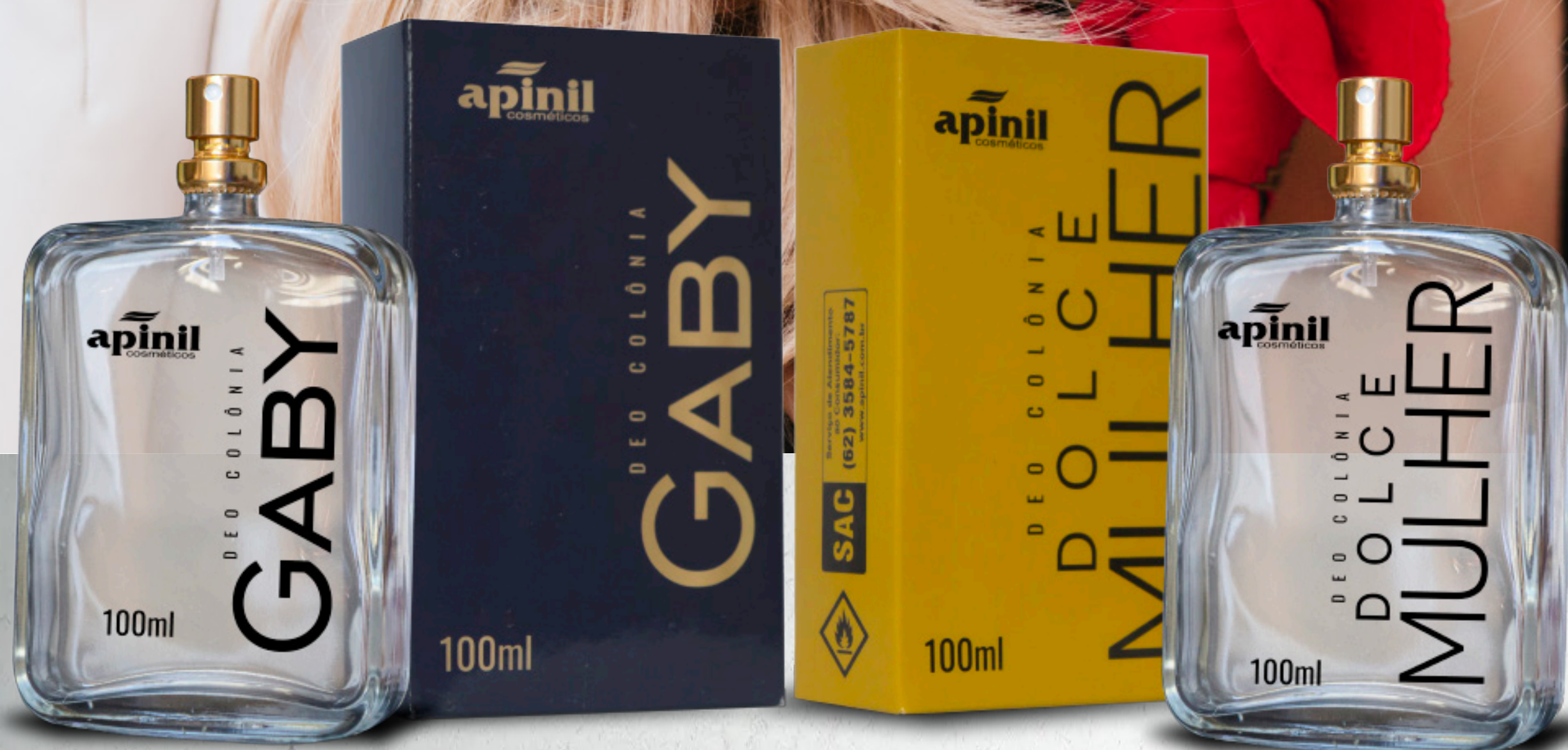
Gaby - 100ml Confiante - Sofisticada - Atraente

A MAGIA DAS FRAGRÂNCIAS MAIS APRECIADAS DO MUNDO