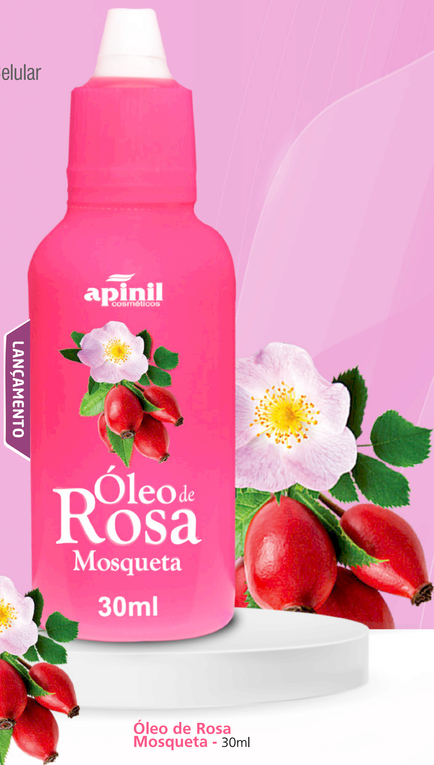
Óleo de Rosa Mosqueta - 30ml